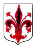
Tavola 18 Scala 1:2000